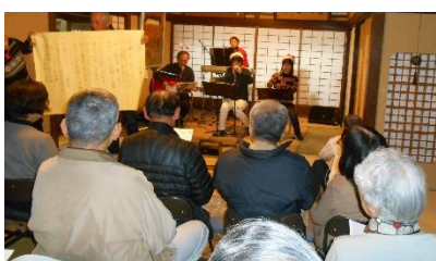
山川豊の新曲を全員で合唱

一年を締めくくる十二月最後のコンサートは、かどやが一般公開された平成二十五年から毎年浜口バンドが務めている。平成三十年もトリは浜口バンドで、「冬が来る前に」や「虹と雪のバラード」等懐かしいフォークに加えて、鳥羽市出身の山川豊の新曲「今日と言う日に感謝して」を熱唱した。前座にはかどやゼンザーズがクリスマス・ソングを演奏した。ここまでは毎年同じだが、今回は昨年長尾オルガン協会に寄贈された六十一鍵のヤマハのオルガンでバッハのプレリュードも演奏された。